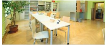
Viele Kliniken sind freundlich und nicht im Krankenhauscharakter eingerichtet.

Man unterscheidet „ offene “ und „ geschlossene “ Stationen . Patienten von offenen Stationen können sich auf dem Krankenhausgelände frei bewegen und nach Absprache auch das Gelände verlassen. Auf geschlossenen Stationen werden Depressionspatienten nur behandelt, wenn sie akut suizidgefährdet sind und eine engmaschige Beobachtung benötigen. Sie dürfen die Station dann nur in Begleitung verlassen.